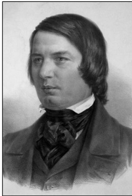
Robert Schumann Zeichnung von Adolph Menzel

Robert Schumann (1810-1856) hat sein Klavierkonzert a-moll op.54 zunächst in Leipzig als Phantasie für Klavier und Orchester im Jahr 1841 begonnen. Schon davor hatte er sich in seiner Zwickauer und Heidelberger Schul- bzw. Jugendzeit mit Klavierkonzerten beschäftigt, aber alle Entwürfe blieben unvollendet, so auch ein längerer Entwurf aus dem Jahr 1839. Private Sorgen belastet ihn schwer, vor allem die Auseinandersetzung mit dem Vater von Clara Wieck, der sich hartnäckig einer Eheschließung widersetzte und erst durch Gerichtsbeschluss gezwungen werden musste, diese zu gestatten. Schließlich konnte die Heirat im Herbst 1840 erfolgen. Das bedeutete auch für die Komposition einen