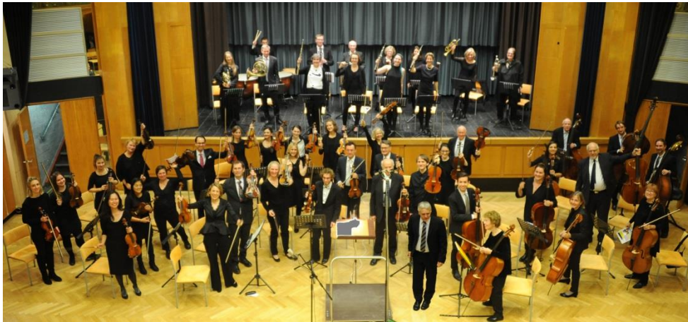
Orchester im November 2018