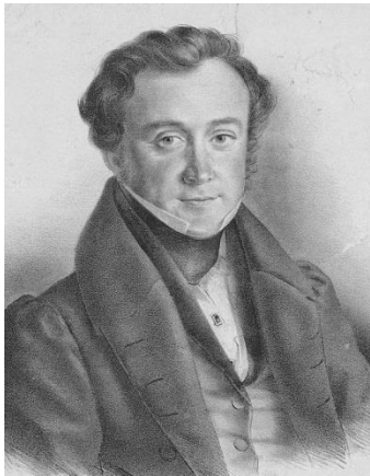
fotografische Reproduktion eines zweidimensionalen Kunstwerks (ca. 1850)

Johann Wenzel Kalliwoda (1801-1866) wurde als Zehnjähriger am Prager Konservatorium ausgebildet und arbeitete nur fünf Jahre später als Geiger im Prager Theaterorchester. Anfang 1822 unternahm er eine Tournee, bei der er auch seinen Bruder beim Fürsten in Donaueschingen besuchte. Da dieses Orchester gerade ohne Kapellmeister war, weil Konradin Kreutzer eine Anstellung in Wien angenommen hatte, bot man Kalliwoda diese Stelle an. Trotz seiner zahlreichen Aufgaben als Hofkapellmeister komponierte er laufend auch Stücke, die nicht für das Musikleben des Fürstenhofs bestimmt waren, weil Verlage für die Verbreitung von Werken wesentlich waren und wichtige Einnahmen darstellten. Auch