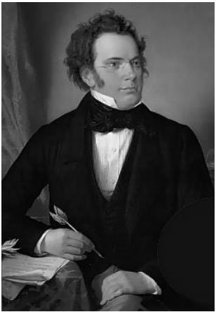
Franz Schubert (Porträt von Wilhelm August Rieder, 1875, nach einer Aquarellvorlage von 1825)

Mit dem ersten Auftritt im neuen Jahr eröffnen wir einen Blick auf die beruflichen Entfaltungsmöglichkeiten von Komponisten zwischen dem ausgehenden 18. und dem frühen 19. Jahrhundert, als einer Zeit gesellschaftlicher Veränderungen. Während ein Großteil des Einkommens durch Aufträge meistens adeliger Personen gesichert wird, gibt es in zunehmendem Maß die Möglichkeit, einem anonymen Publikum Musikalien zu verkaufen, wenn man die nötigen Verbindungen zu Verlegern aufbauen kann. Diese berufliche Situation gilt für alle drei im Programm vertretenen Komponisten.